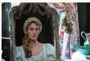
Madame de Bargeton