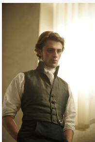
Lucien de Rubempré

Selon les décomptes, les personnages de la Comédie Humaine sont au nombre de 4000 à 6000. Ils sont parfois récurrents et réapparaissent d'un roman à l'autre, c'est le cas de Lucien de Rubempré (Lucien Chardon) qu'on retrouve dans Splendeurs et misères des courtisanes . Ils dépeignent la société du XIX ème siècle et les différentes positions sociales de l'époque.