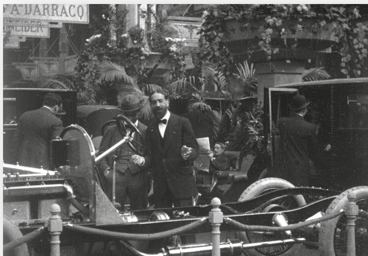
PHOTOGRAMME DU XVE SALON DE L'AUTOMOBILE INAUGURÉ PAR LE PRÉSIDENT DE LA RÉPUBLIQUE RAYMOND POINCARÉ (1919)

2. Quelles sensations ou quelles émotions peuvent-ils susciter ?