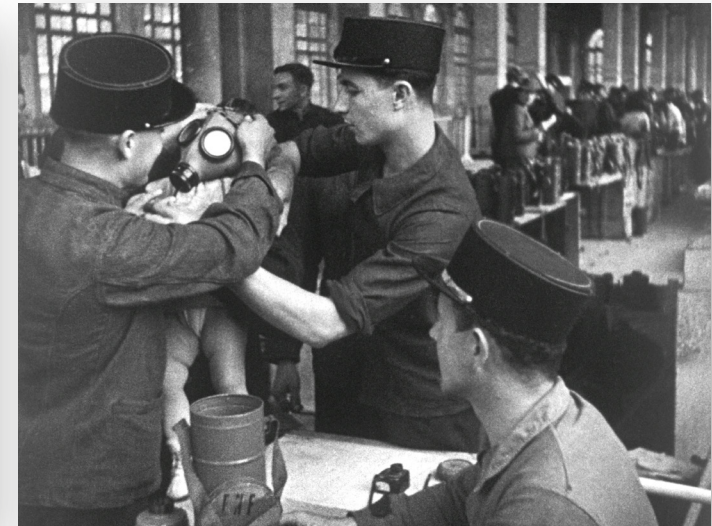
GAUMONT ACTUALITÉS / PHOTOGRAMME "JEUNESSE DE FRANCE" (1939)

Quelles sont les limites du cinéma comme média d'information ? Pourquoi est-ce important de savoir qui a produit une image, qui a décidé de la diffuser ? Quelle technologie récente vient encore faire évoluer les images d'actualité et renforcer la nécessité de faire preuve d'esprit critique ?