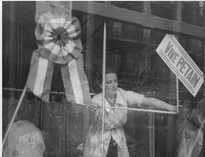
GAUMONT ACTUALITÉS / PHOTOGRAMME "PÉTAIN ET LA FRANCE" (1941)