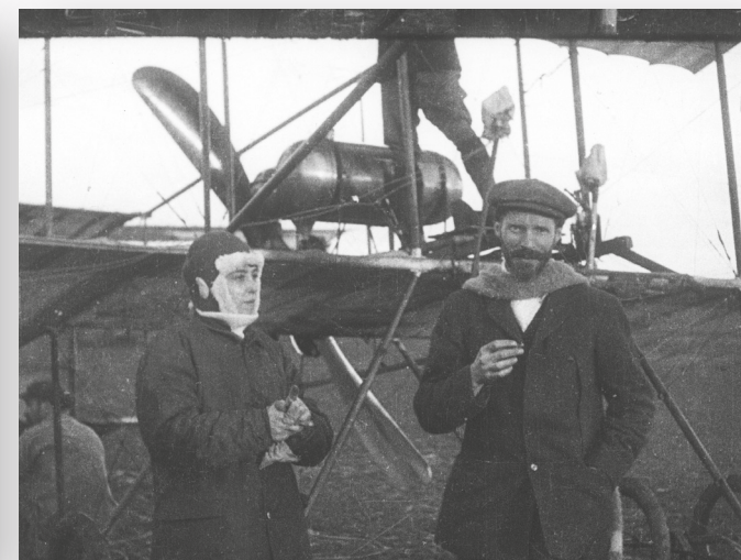
PHOTOGRAMME D'HÉLÈNE DUTRIEU, AVIATRICE, QUI VIENT DE BATTRE LE RECORD FÉMININ DE L'AÉROPLANE AVEC 60KM EN UNE HEURE (1910)