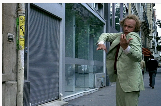
Le Grand Blond avec une chaussure noire d'Yves Robert (1972)