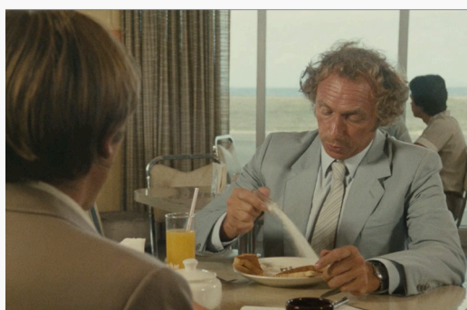
La Chèvre de Francis Veber (1981)