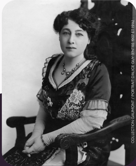
PORTRAIT D'ALICE GUY (ENTRE 1907 ET 1914)