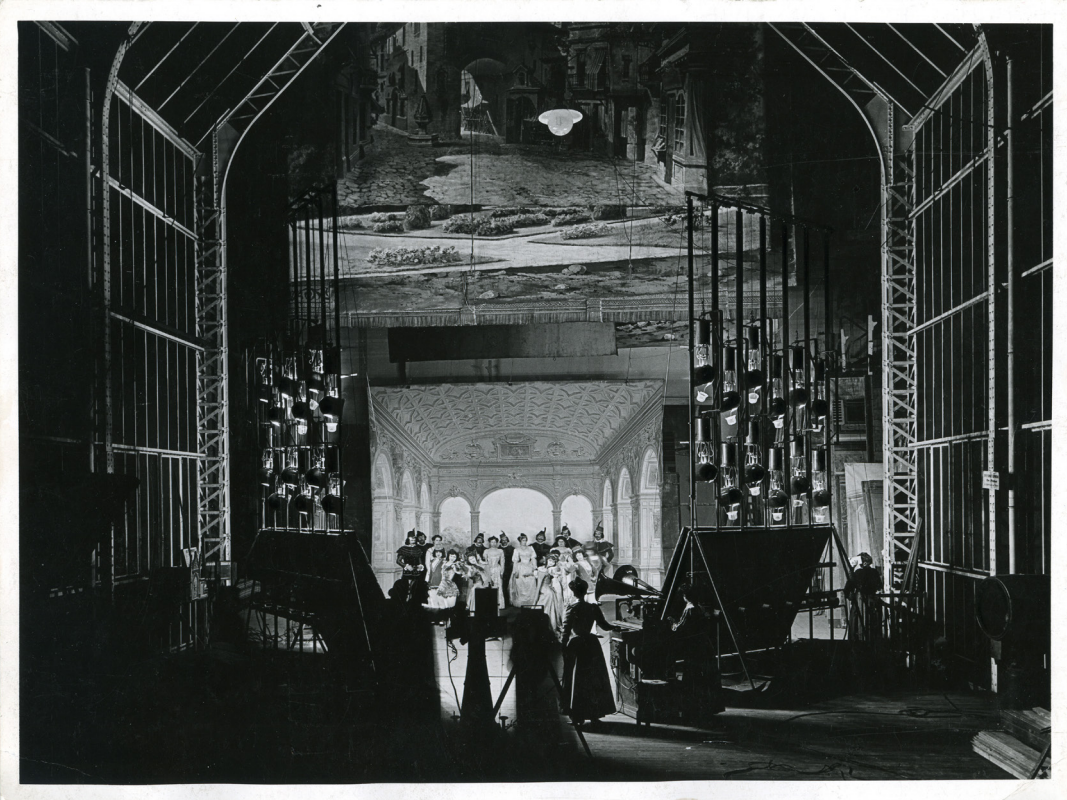
ALICE GUY TOURNE UNE PHONOSCÈNE ROMÉO ET JULIETTE (1906)

Pionnière dans un univers largement masculin, elle est aujourd'hui considérée comme la première femme réalisatrice en France.